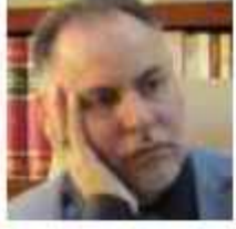
يقلم: جمعة الساخري