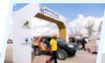
انطلاق رالي تي تي للرياضات الميكانيكية وسباق السيارات الصحراوية والدراجات النارية بؤدان

قام رئيس مجلس النواب المستشار عقيله صالح: بزيارة تفقدية لمستشفى الجلاء التعليمي للجراحة والحوادث في مدينة بنغازي، رافقه خلالها رئيس الحكومة الليبية الدكتور أسامة حماد، ومدير عام صندوق التنمية وإعادة إعمار ليبيا المهندس