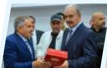
القائد العام يزور معرض بنغازي الدولي للكتاب في نسخته الرابعة