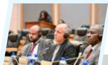
أعضاء مجلس النواب يشاركون في الجلسة السادسة للبرلمان الإفريقي