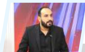
الرقابة الدستورية... درع الدولة وميزان السلطات