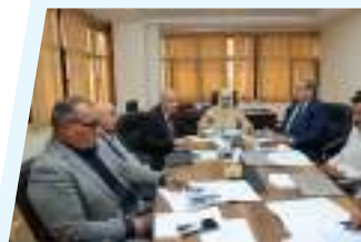
3ص لجنة شؤون التعليم تعقد اجتماعاً مع وزير التربية والتعليم لبحث عدد من الملفات التربوية والتعليمية