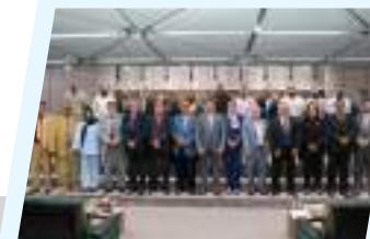
4ص ديوان مجلس النواب يستضيف اجتماعات المكتب التنفيذي لاتحاد الصيادلة العرب