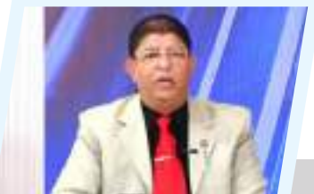
5ص الدكتور فايز بوجواري: "لا حل حقيقي في ليبيا إلا بحوار وطني جامع"