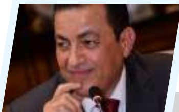
8ص "الإعلام العربي ظلم ليبيا كثيراً.." هكذا تحدث سامي كليب