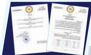
المهندس بالقاسم حفتر يصدر قراراً ببيع السلع الأساسية بأسعار مدعومة