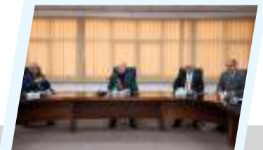
رئيس ديوان مجلس النواب يتابع سير العمل وتطوير الأداء بالديوان