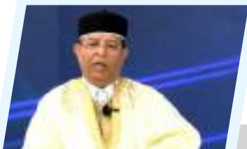
ليبيا بين الهاشمية الداخلية وتحولات الإقليم.. نحو دولة مستقرة ووحدة