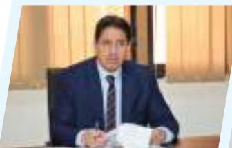
العتوري يبحث آلية صرف مستحقات الشركات المنفذة لأعمال لجنة الطوارئ بسبها