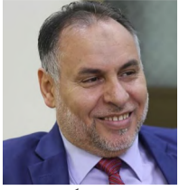
■ بقلم: جمعة الفخري