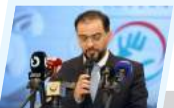
رئيس مجلس الوزراء يشارك في فعاليات مؤتمر الرابطة العربية لإجراحة الأطفال