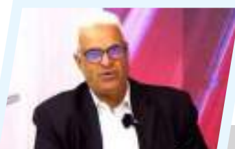
السيطي: مجلس النواب والقوات المسلحة هما ركيزتا السيادة الوطنية