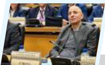
افتتاح أعمال الدورة العادية الخامسة للبرلمان الإفريقي