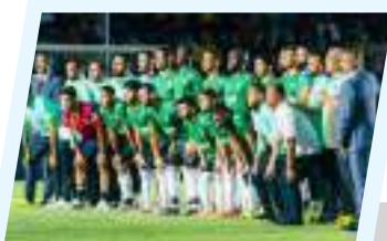
المنتخب الليبي بطلاً لأفريقيا في الميني فوتبول

وأكد المجلس في بيانه أن ما يجري من منع ممنهج لدخول الغذاء والدواء والمساعدات الإنسانية، وحرمان متعمد لملايين المدنيين من أبسط حقوقهم في الحياة، يُعد جريمة ضد الإنسانية تستوجب تحركاً دولياً عاجلاً وحازماً، بعيداً عن المعايير المزدوجة والصمت المخزي.