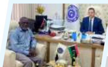
النائب محمد امدرور يلتقي وزير الخارجية عبد الهادي الحويج