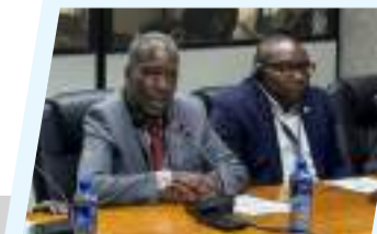
صالح قامة رئيساً للجنة القواعد والامتيازات بالبرلمان الإفريقي 2ص