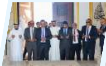
وفد المجلس البرلماني الآسيوي الأفريقي يزور ضريح شيخ الشهداء عمر المختار 9ص