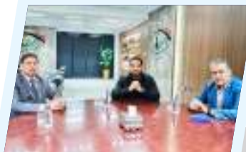
فريق الرقابة على قرارات مجلس الأمن يبحث ملف الأموال المجددة 5ص