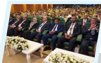
مؤتمر بنغازي الطبي في دورته الثالثة يناقش الذكاء الاصطناعي وتوطين العلاج