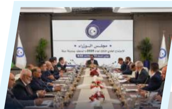
الحكومة الليبية تعقد اجتماعها الثالث لعام 2025 في درنة