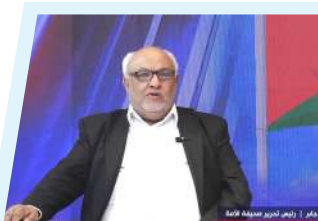
رئيس تحرير صحيفة الأمة يؤكد: فلسطين في وجدان الليبيين منذ الأزل