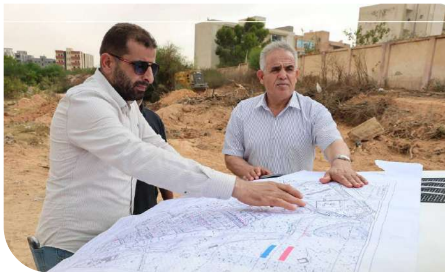
مكتب العلاقات العامة والإعلام