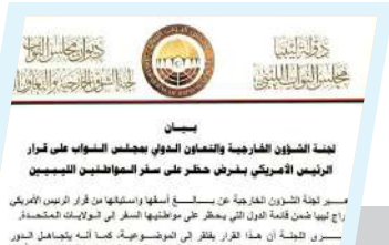
الخارجية البرلمانية: ندين الحظر الأمريكي.. ونطالب بالمعاملة بالمثل