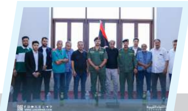
الفريق خالد حفر يلتقي إدارة نادي الأخضر ويؤكد دعمه للرياضة والشباب

كما جرى خلال اللقاء استعراض ما قدمته الأمم المتحدة خلال السنوات الماضية في ليبيا، وفي نهاية اللقاء أكد الجانبان على أهمية استمرار التنسيق والتشاور لما يخدم مصالح الشعب الليبي، ويساهم في دعم مسارات الانتقال السياسي من خلال المؤسسات الليبية ووضع استراتيجيات واضحة للبعثة تساهم في الاستقرار بليبيا من خلال المؤسسات الليبية القائمة.