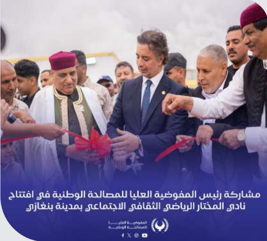
مشاركة رئيس المفوضية العليا للمصالحة الوطنية في افتتاح نادي المختار الرياضي الثقافي الاجتماعي بمدينة بنغازي

شارك رئيس المفوضية الوطنية العليا للمصالحة الوطنية، الدكتور الصدّيق حفتر، في افتتاح نادي المختار الرياضي الثقافي الاجتماعي، الذي أقيم بمدينة بنغازي، وسط حضور لفيف من الشخصيات المجتمعية والرياضية.