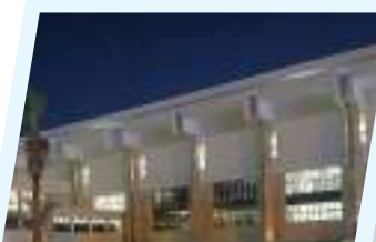
افتتاح الدورة الرابعة لمعرض بنغازي الدولي للكتاب تحت شعار "الإعمار والسلام"