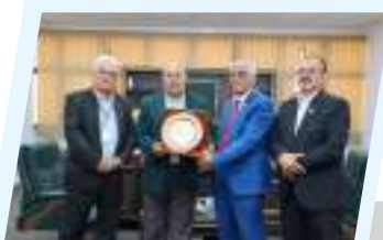
تكريم رئيس ديوان مجلس النواب تقديراً لدمه لمؤتمر الوظيفة العامة في ليبيا