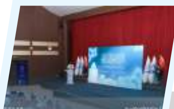
بنغازي تحتضن ندوة علمية حول الزكاة والصدقة ودورها في تحقيق التنمية المستدامة