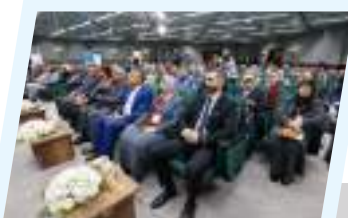
ديوان مجلس النواب يستضيف المؤتمر العلمي لكلية الصحة العامة