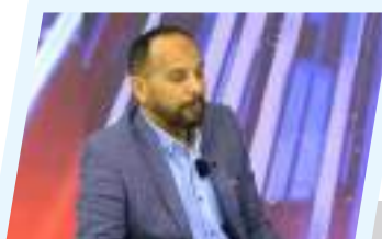
خرائط الطريق الأهمية.. البحث عن استقرار ضائع في ليبيا