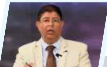
ملف الهجرة غير الشرعية.. التحديات والمسؤوليات 9ص

وأشاد النائب الثاني لرئيس مجلس النواب، خلال اللقاء، بالدور الذي يضطلع به مجلس