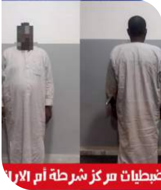
ضبطيات مركز شرطة أم الأرناب

تمكّن أعضاء مركز شرطة أم الأرناب التابع لمديرية أمن مرزق من ضبط المدعو (م.ع.أ)، وهو يحمل الجنسية التشادية، لكونه مطلوباً على ذمة قضية تتعلق بالنصب والاحتيال على ممتلكات خاصة، منذ بداية شهر أبريل من عام 2026م. وجرى اتخاذ كافة الإجراءات القانونية اللازمة حياله، حيث تم إحالته إلى جهات