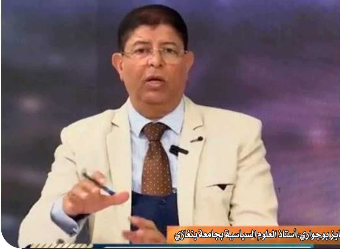
د. فايز بوجواري، أستاذ العلوم السياسية بجامعة بنغازي

في ظل التحولات المتسارعة التي تشهدها المنطقة، وتعاظم التحديات المرتبطة بالأمن الحدودي والهجرة غير الشرعية، والجريمة المنظمة العابرة للحدود، تبرز ليبيا اليوم بوصفها نقطة ارتكاز محورية في المعادلة المتوسطة، وممراً رئيسياً لتدفقات بشرية معقدة تتداخل فيها الأبعاد الإنسانية بالأمنية والسياسية والاقتصادية.. وبين هذه التعقيدات، يكتسب أي لقاء دبلوماسي أو أممي بين الأطراف المحلية والدولية أهمية خاصة، باعتباره محاولة لإعادة ضبط التوازن في ملف بالغ الحساسية.