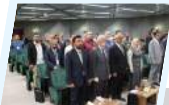
ملتقى وطني في بنغازي يناقش تعزيز خدمات الصحة النفسية والدعم النفسي الاجتماعي 4ص