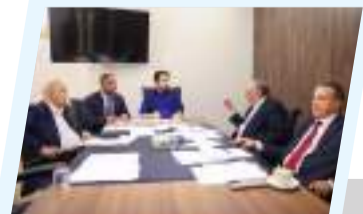
لجنة برلمانية تتهيء دراسة مقترح تعديل قانون التعليم العالي والتقني 2ص