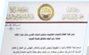
لجنة الطاقة والموارد الطبيعية ترحب بعودة مصفاة رأس لانوف للدولة الليبية 5ص