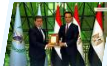
المهندس بالقاسم حفتر يجري لقاءات مع كبار المسؤولين في مصر 3ص